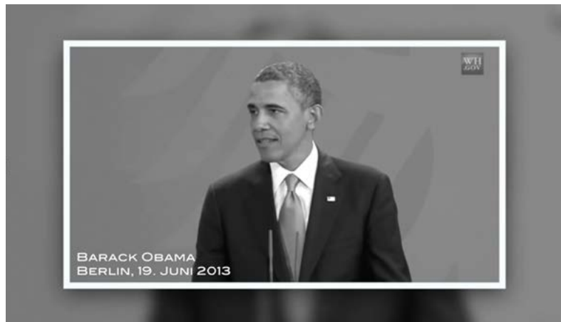
US-Präsident Barack Obama dementierte bei seinem Berlin-Besuch vorsorglich alles – auch das, was nie jemand behauptet hatte.

Dass wir auf der richtigen Spur waren, erkannten wir an den nervösen Reaktionen während unserer Recherchen: Wir wurden von Sicherheitskräften angegangen, Wachleute notierten sich unsere Nummernschilder und filmten unse-re Gesichter. Und immer wieder wurde die Polizei gerufen,