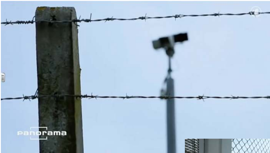
Links: Wachsam blicken Kameras auf alle, die sich der Außenstelle des britischen Geheimdienstes GCHQ in Bude nähern.