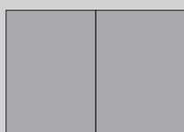
2/1 SEITE + 3 mm Beschnitt Breite 420 mm Höhe 280 mm